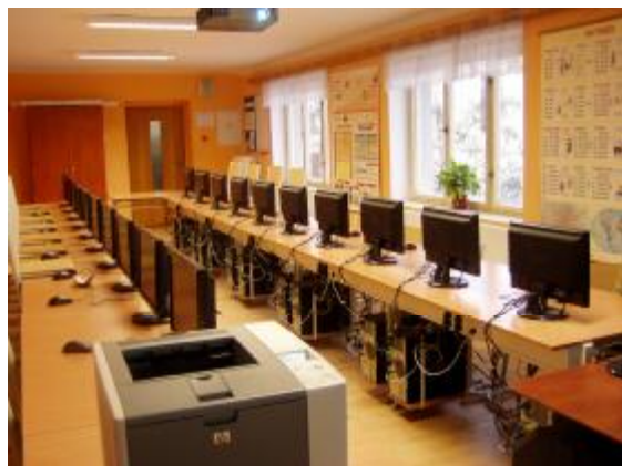
Nová jazyková učebna z prostředků grantu

Další informace o škole získáte na adrese www.zssemice.cz