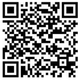
QR kód pro Apple

Mobilní aplikaci pro informace z obce si můžete stáhnout buď ze stránek obecního úřadu, či přes čtečku QR kódů přímo do svého mobilního telefonu.