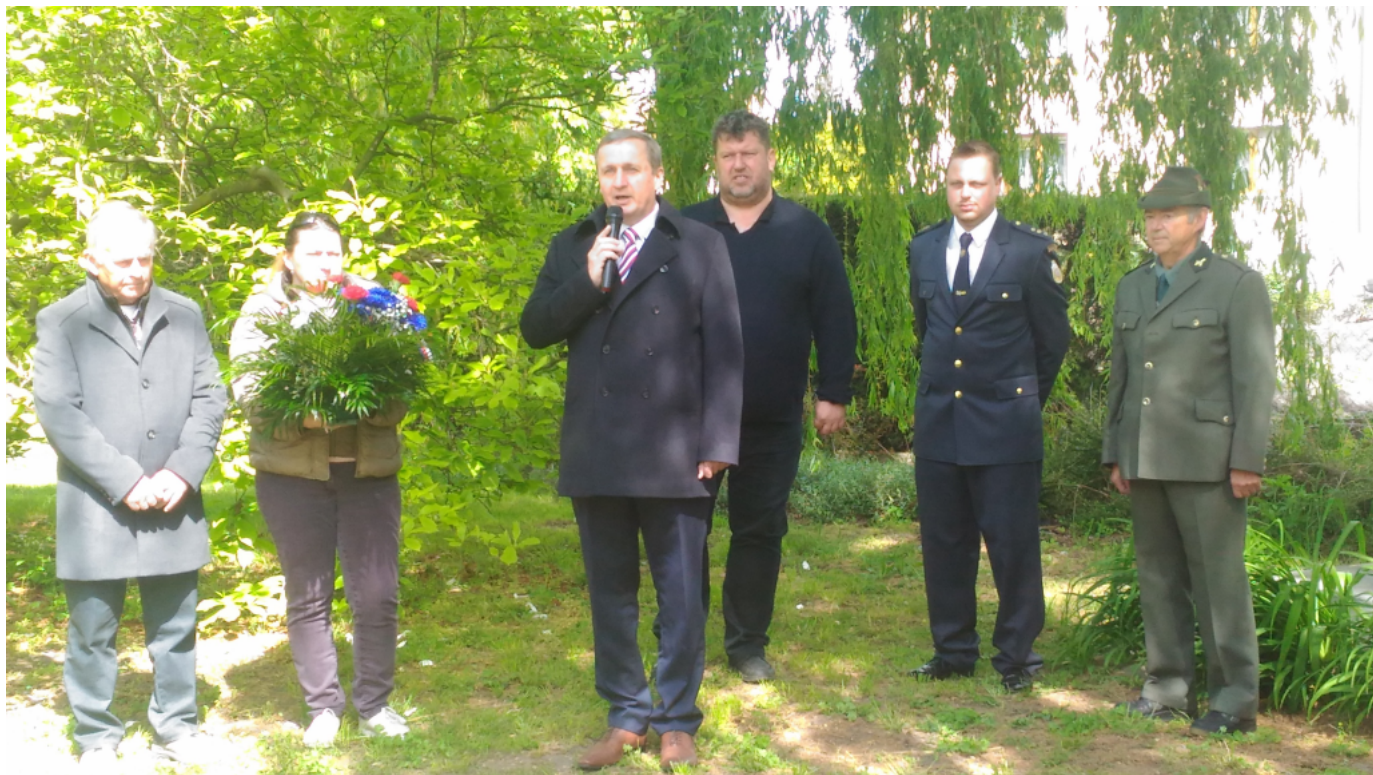
obrázek: Pietní akt u pomníku k výročí osvobození naší vlasti