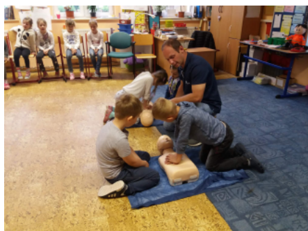
Den pro záchranu života - nácvik resuscitace

Výběh školních akcí je opravdu pestrý. Uspěli jsme celkem pět zotavovacích zájezdů (lyžařský výcvik pro druhý stupeň, dva zimní ozdravné pobyty pro první stupeň a dva školy v přírodě). Žáci se svými učiteli absolvovali jednodenní nebo vícedenní výlety a exkurze. Své akce si zorganizovala také školní družina.