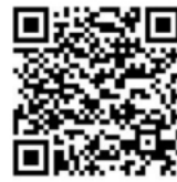
QR kód pro Apple