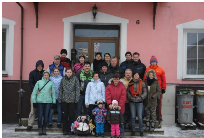
Společná foto ze zimního soustředění

Abychom nevyšli ze cviku, tak jsme se 11. 4. zúčastnili okrskového cvičení v dálkové přepravě vody. Osvojením této techniky nám žeme být, jakožto dobrovolní hasiči, platnými pomocníky profesionálních hasičů. Zejména v případě rozsáhlých požárů. Proto vždy uvítáme, když si nám žeme ověřit, že jsme na tuto situaci připraveni a dokázali bychom ji zvládnout.