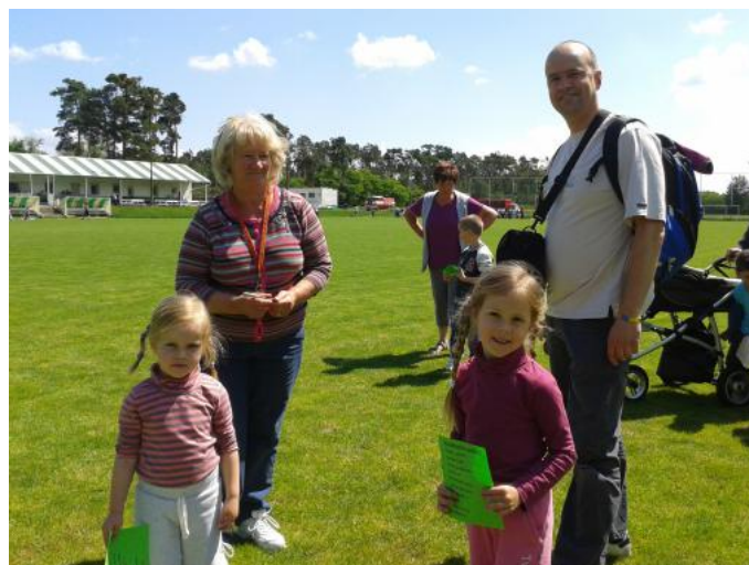
Dítký den na h íšti

Poté již promýšlely kvapem se blížící Den matek - ten byl prakticky v jejich režii. Radost a pohoda našich obanek - maminek a babí ek, které si posedly, zavzpomínaly a při malém ob erstvení zazpívaly, je patrná z p iložných fotografií. Den d tí na počátku ervna je zatím jejich poslední společnou akcí. I zde byly platnými spoluorganizátorkami, na nichž je vidět obrovská praxe z výchovy d tí a vnou at.