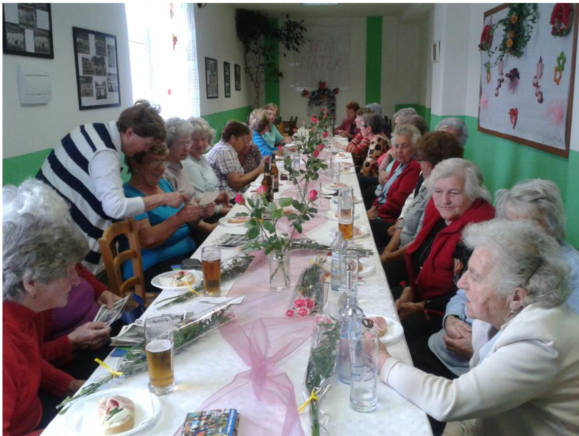
V p ísálí sokolovny se uskute nilo 9.5. milé setkání žen u p íležitosti Dne matek, více o ínnosti našich senierek uvnit í listu na str. 2 a 3.