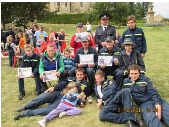
Po úspěšné soutěži v Běství

Hned druhý den po plese se všichni „životaschopní“ bratři sešli a uklidili sál Sokolovny. Aby toho uklízení nebylo pro jeden den málo, tak jsme rovnou uklidili i vánoční výzdobu naší obce.