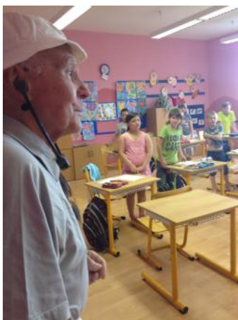
O vzácné návště v v základní škole t te na stran 11 a 12.