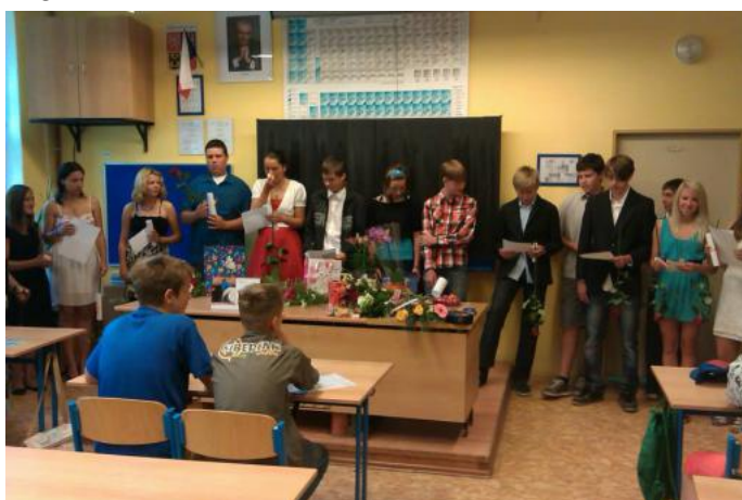
Poslední rozloučení devátáka se spolužáky a učiteli