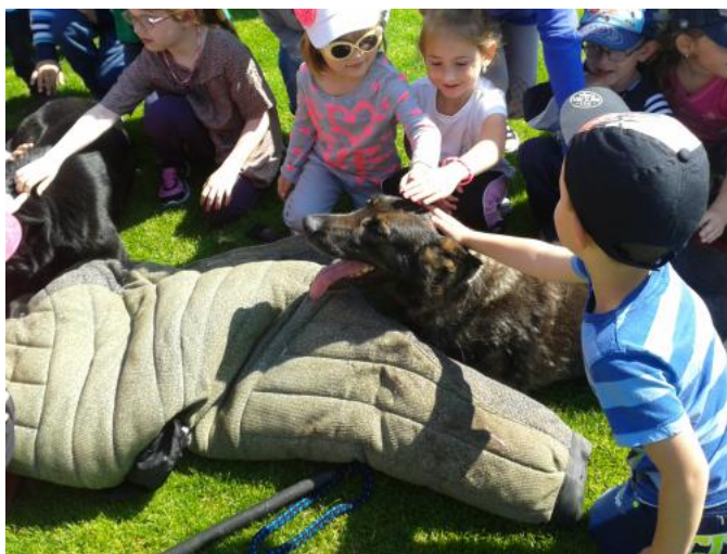
Velkou pozornost děti přitahovali ty nozí kamarádi

Po návratu z pohádkového lesa se děti vrhly na dovednostní disciplíny, které probíhaly na hřišti. Pod přísným dohledem našich rozhodčích – senierek si děti vyzkoušely například skákání v pytlíku, hod a kop na cíl, koulení pneumatik,