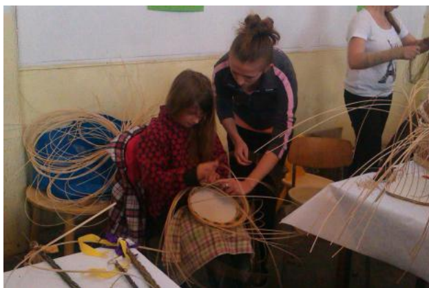
Přítomní si zkusili pletení z pedigu