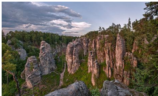
Kouzelné Prachovské skály