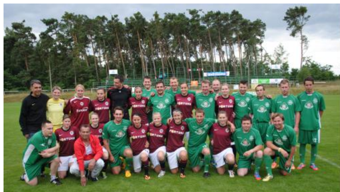
Foto z oslav 100 let Sokola Semice