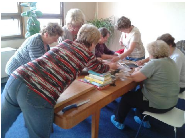
Obalování knih v knihovně

"Divata" se začala scházet v prostorách obecní knihovny, která se pro ni stala jakousi základnou a zázemím. Hned nabídly své šikovné ruce a pomáhaly několik týdnů opravovat a balit knihy. Brzy následovala akce v sokolovně - 18.dubna v předvečer Velikonoc byly velkou oporou při Velikonocích v tradici a čemeslech.