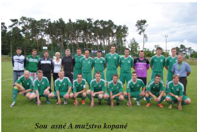
Současná A mužstvo kopané

Po sezoně 2002/2003, kdy AFK Sokol Semice sestoupil do divize, prošel další sestup až do krajského úrovně, kde tým působí i nyní a je tradičním účastníkem této soutěže.