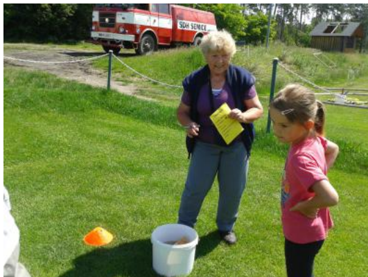
Hasiči se postarali o dobrou náladu na Dni dětí

V dubnu jsme sbírali staré železo. Nebyli jsme ovšem sami. Na druhém konci obce se o sběr vámi připraveného železa pokoušeli i naši cizí výrostci. Naštěstí máme všímavé spoluobčany, kteří nás o těchto nekalých praktikách včas informovali a my jsme „škodnou“ zahnalí (nikdo nebyl v průběhu tohoto manévru zraněn, zhmožděn ani zesměšněn – pozn. autora). Všem zúčastněným patří velký dík.