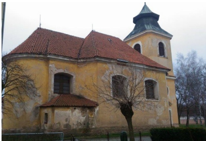
kostel sv. Má í Magdalény z roku 1731

Rozhodn nejsme malou obcí, tak tomu ur it není. Denn tudy projede nebo projde mnoho lidí. Je to zp sobeno tím, že je zde mnoho míst, která cht jí z r zných d vod navštívit. Pat í mezi n firmy, škola a školka, obecní ú ad, zdravotní centrum, hospody a restaurace, prodejny, sportovišt a další. Nesmíme zapomenout také na turisty a cyklisty. Abychom usnadnili orientaci všem takovým, cht li bychom jim toto usnadnit jednoduchým zna ením všech d ležitých míst a objekt , které zde máme. Plánujeme tedy v centru obce instalovat informa ní tabuli s krátkou charakteristikou naší obce a orienta ní mapou. Tu doplní centrální rozcestník, aby bylo každému jasné, jakým sm rem se daný objekt nachází. Toto bude dopln no díl ími sm rovkami v obci, které každého dovedou do požadovaného cíle. Když p jde vše podle plánu, cht li bychom vše zrealizovat do konce prázdnin.