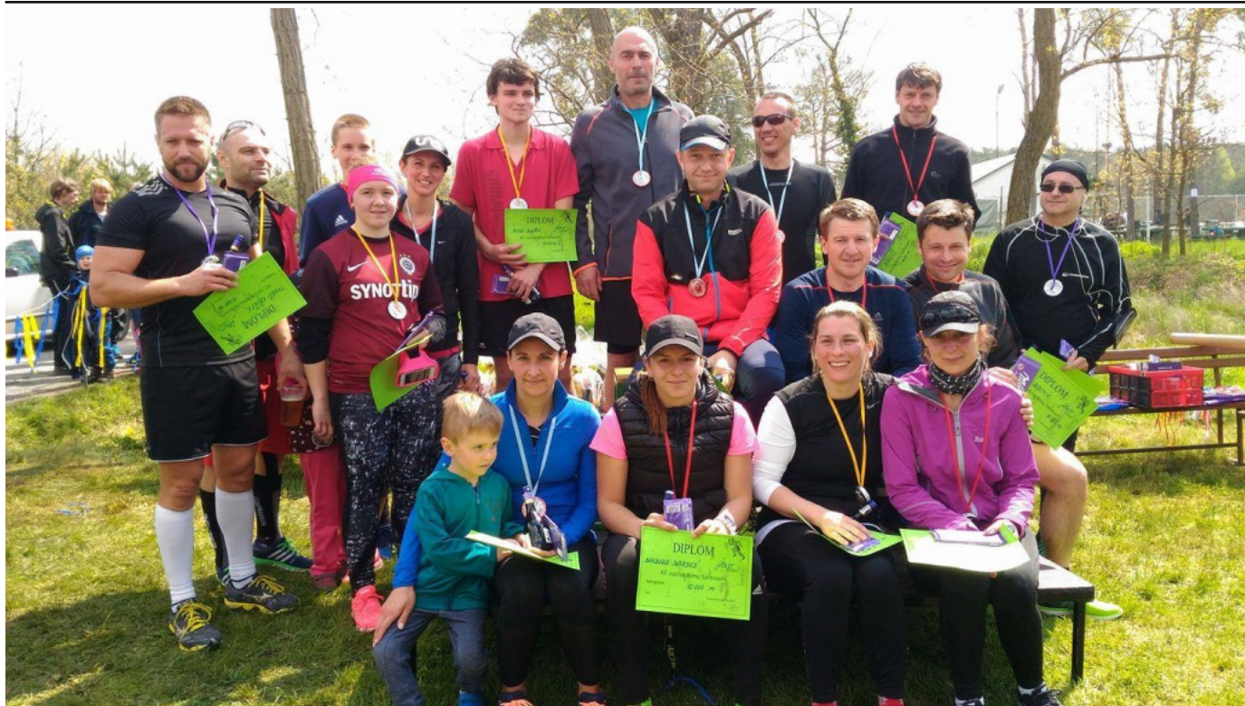
47. ročník B hu Semicemi -Semi tí borci