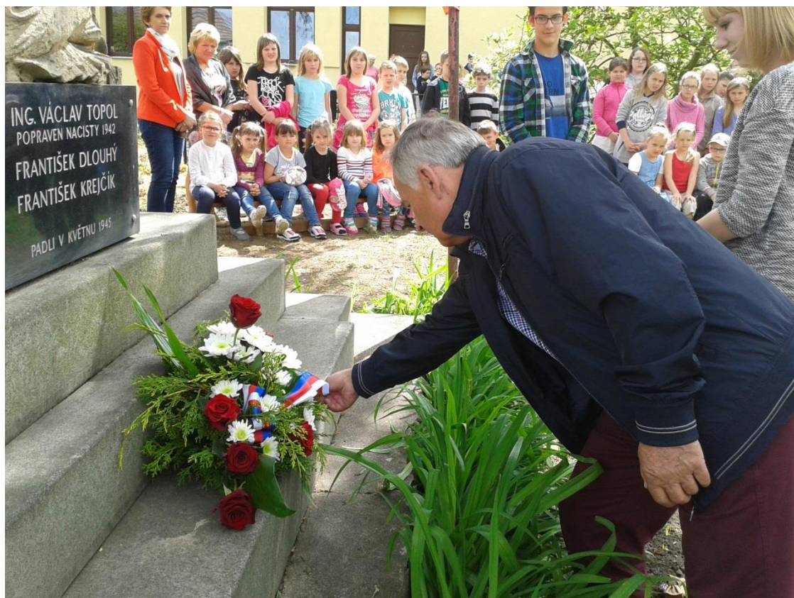
Pietní akt u pomníku padlým v Semicích při příležitosti 70. výročí konce 2. světové války.