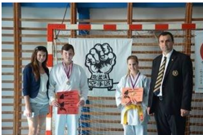
Semická výprava na turnaji