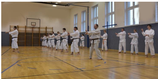
soustředění v Semicích